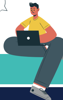
Diagrama de Cursado