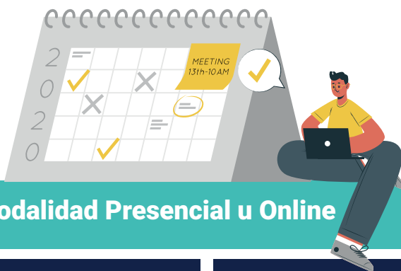
Diagrama de Cursado